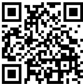
Webseite PH "Hochschulsport"

Weiter Informationen zum Hochschulsport kannst du auch hier finden