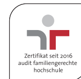
27 x 27 mm, Text 6 pt