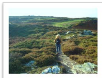
Auslandssemester in Irland