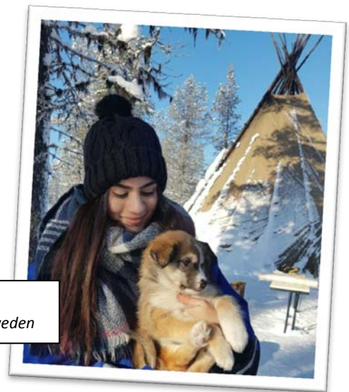
Auslandssemester in Schweden

Du möchtest lieber an eine unserer Partnerunis ? Dann ist es jetzt an der Zeit, dich in der Liste unserer Kooperationen durchzuklicken und zu schauen, welche davon für dich in Frage kommen und zu deinem Studiengang passen. Lies dir auch die Erfahrungsberichte durch!