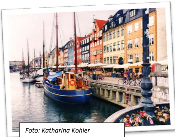
Auslandssemester in Dänemark

Bitte beachte: Oft sind die Auswahlgespräche in den Semesterferien!