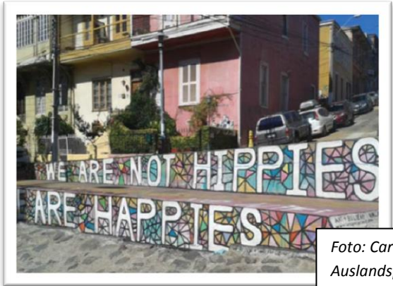
Auslandspraktikum in Chile

Eine kleine Schritt-für-Schritt Anleitung