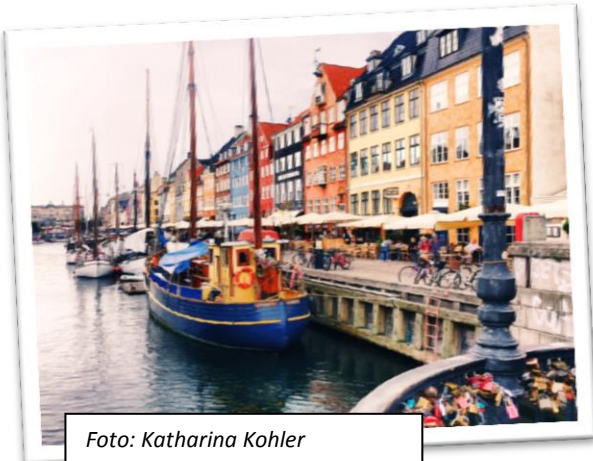
Auslandssemester in Dänemark

Bitte beachte: Oft sind die Auswahlgespräche in den Semesterferien!