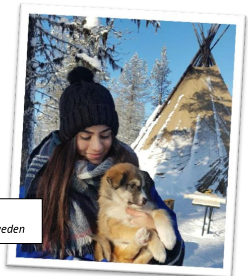
Auslandssemester in Schweden

Du möchtest lieber an eine unserer Partnerunis ? Dann ist es jetzt an der Zeit, dich in der Liste unserer Kooperationen durchzuklicken und zu schauen, welche davon für dich in Frage kommen und zu deinem Studiengang passen. Lies dir auch die Erfahrungsberichte durch!